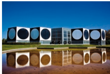
Photographies de Xavier Zimbarido

Retrouvez l'ouvrage en vente à la Fondation Vasarely