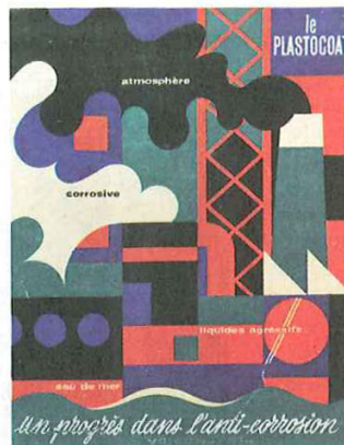
Victor Vasarely, Plastocoat , huile sur carton, 26,5x21 cm, 1934