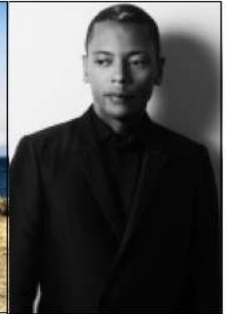
"Une autre terre", sujet de réflexion et de création pour Mills.