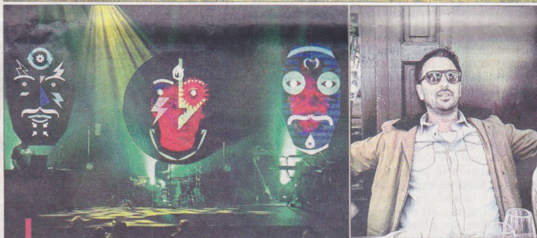
Belle animation au menu, samedi sur les calmes pelouses et les façades de la Fondation Vasarely avec 7 groupes et DJ dont Kulte Sound System et le "mapping" vidéo de "Your Tailor is a Punk !!!"

l'association sociale et solidaire "Tous à Table" grâce à laquelle des personnes en difficulté vont pique-niquer d'un repas complet pour une somme très symbolique.