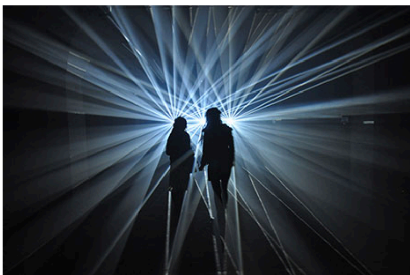
Tropique © Etienne Rey, 2012

La démarche d'Etienne Rey est fondée sur la notion de coexistence. Il explore les relations invisibles et réciproques qui se jouent entre l'homme et son environnement. Ici, il s'agit moins de capter les mouvements de visiteurs, que de saisir la manière dont travaille notre système perceptif.