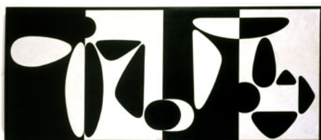
Victor Vasarely, Tampico, 1953

À la fin de la guerre, Vasarely tâtonne en se livrant à des essais à partir du cubisme, de l'impressionnisme, du futurisme et du surréalisme. Il participe en 1944 à Paris à la fondation de la Galerie Denise René. Il y expose pour la première fois ses études graphiques comportant beaucoup d'effets optiques à partir des rayures du zèbre et du damier d'un jeu d'échecs, ainsi que ses travaux publicitaires [...].