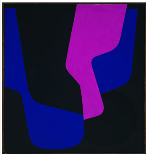
Victor Vasarely, Darjeeling, 1952, Mumok © Victor Vasarely ADAGP, photo museum moderner kunst stiftung ludwig wien, SABAM Belgium 2013

Vasarely entame bientôt un deuxième cycle de peintures intitulées Denfert où s'enchaînent les formes souples et tendues complétées de combinaisons colorées raffinées dont témoigne le tableau Darjeeling. Viennent ensuite, mais en réalité les choses sont quasiment simultanées et se recoupent les unes les autres, les périodes dites Gordes et Cristal où s'affirme son style, davantage fondé sur les verticales, les horizontales et les obliques à 45°, les surfaces bien délimitées, les couleurs ramenées à une dominante et à des variations, une facture neutre, une surface mate. Vasarely affirme un parti, celui de la verticalité, la verticalité du plan assimilé au mur, la verticalité de la composition [...]. Ces œuvres s'imposent par leur équilibre, leur clarté et leur monumentalité [...].