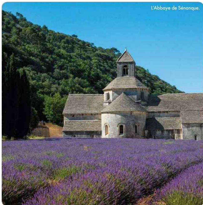
L'Abbaye de Sénanque.