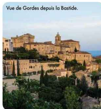
Vue de Gordes depuis la Bastide.