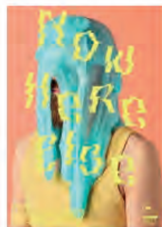
Now Here Else