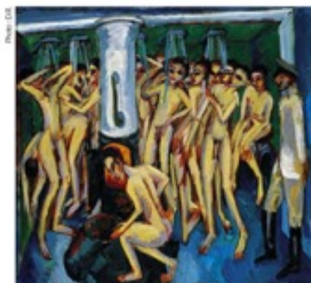
Ernst Ludwig Kirchner, Das Soldatenbad (Soldats aux bains), 1915, huile sur toile, 140 x 150 cm.