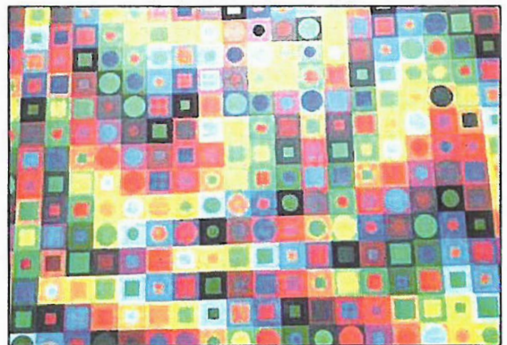
l'alphabet de Vasarely