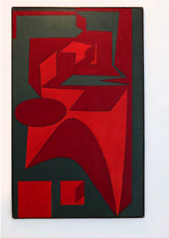
"Tengrinor", 1948 de Victor VASSARELY - Courtesy Galerie Denise René Paris © Photo Éric Simon

géométriques se combinent, s'emboîtent, se permutent et s'assemblent. L'artiste crée un alphabet plastique dont les combinaisons infinies doivent donner naissance à un « art cérébral et méthodique ».