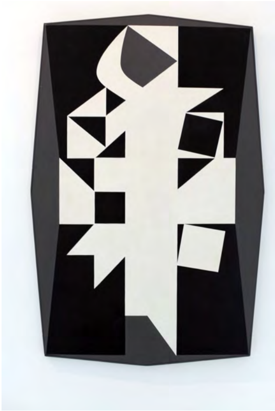
"Tlinko bc", 1955 - 1964 de Victor VASSARELY - Courtesy Galerie Denise René Paris